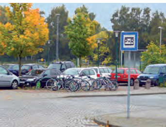
Park & Ride / Bike & Ride am Bahnhof