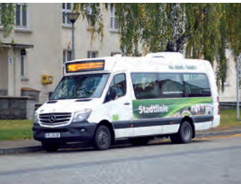
Pritzwalker Stadtbuslinie 902

Informationen zum Nahverkehr, Stand 10. November 2015