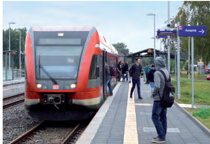
Neu errichtete Bahnsteige im Bahnhof Pritzwalk

Mit der Stadtbuslinie 902 kommen die Pritzwalker Bürger und Gäste bequem zum Zug. Ende letzten Jahres wurde die Stadtlinie gestartet und seitdem fährt sie auf zwei Runden durch die Stadt. Eine Tour fährt ab Bahnhof über Rathaus, Krankenhaus, das westliche und nördliche Stadtgebiet mit dem Einkaufszentrum in der Rostocker Straße sowie Gewerbegebiet Ost zurück zum Bahnhof. Die andere Tour startet am Bahnhof und fährt zuerst den Osten, Norden und Westen ab, bis sie schließlich südlich des Marktes wieder Kurs auf den Bahnhof nimmt. Beide Wege werden wochentags ca. alle 40 Minuten angeboten, sodass vom und zum Bahnhof abwechselnd etwa alle 20 Minuten ein Stadtbus fährt. Alle Busse haben dadurch direkten Anschluss zum bzw. vom RE6 sowie